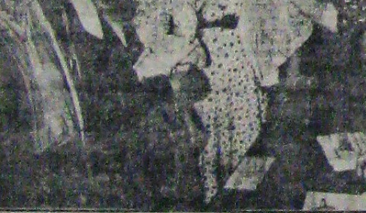
Din prinosul altora prin «Ajutorul Legionar» familiile nevoiașe lais un moment impresionant la sediul «Ajutorului Legionar»...

Zăgăzită în minte, icona noastră a soteriilor celor lipsiți de stăruință necesară, fără ca această lipsă să fie din viața lor.